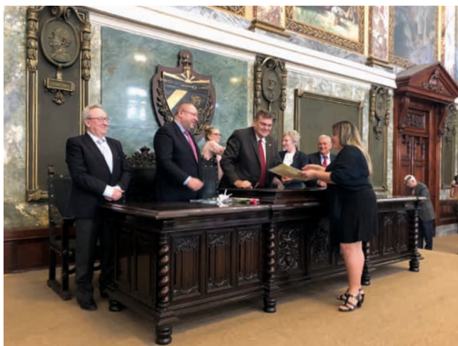
Entrega de los títulos de Doctor a los alumnos de los Programas Iberoamericanos de Doctorado en convenio entre las universidades andaluzas y cubanas. Paraninfo de la Universidad de La Habana, 12 de febrero.