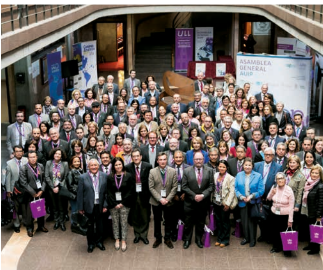
Arriba: participantes en la Asamblea General de la AUIP celebrada en la Universidad de La Laguna. Foto superior derecha: representantes de la nueva Comisión Ejecutiva elegida por la Asamblea General el 22 de marzo de 2018. Foto inferior derecha: reunión de Directores Regionales de la AUIP en la Universidad de Salamanca, España, 21 de noviembre de 2018.