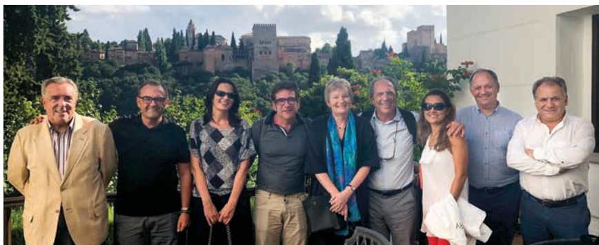
Reunión de directivos de la AUIP, coordinadores de redes de investigación y doctorados iberoamericanos con la Vicerrectora de Internacionalización de la Universidad de Granada. Carmen de la Victoria, 18 de septiembre de 2018.