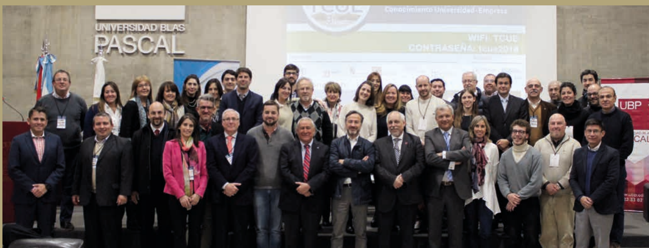
Jornadas sobre Transferencia de Conocimiento Universidad Empresa celebradas en al Universidad Blas Pascal, Córdoba, Argentina, el 7 y 8 de juniode 2018.