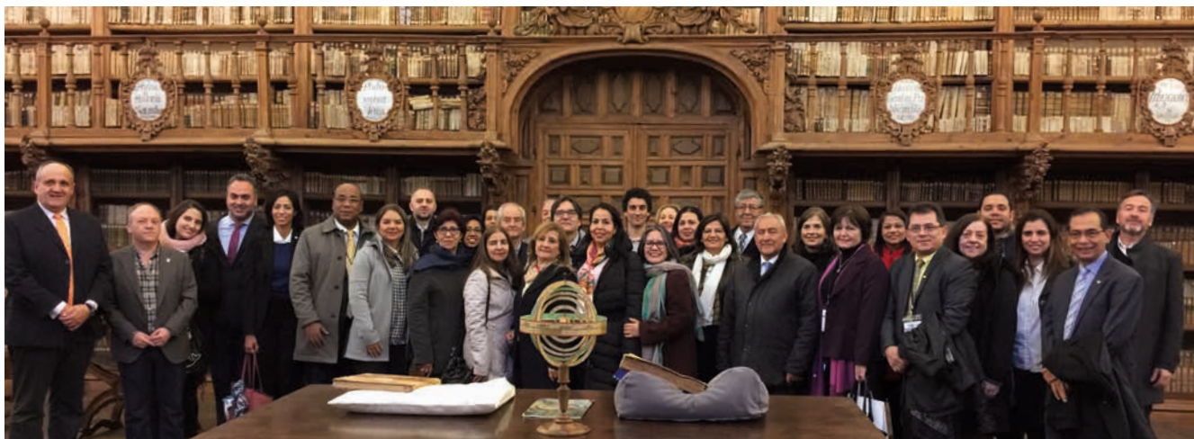
Visita a la biblioteca histórica de la Universidad de Salamanca de los directores regionales de la AUIP y de los participantes a la Reunión Técnica Internacional sobre la Calidad del Postgrado en Iberoamérica. 22 de noviembre de 2018.