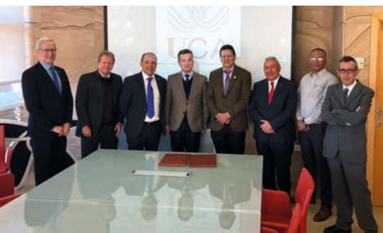
Visita del rector de la Universidad del Valle, Colombia, a la Universidad de Cádiz acompañado de los directores generales de la AUIP.