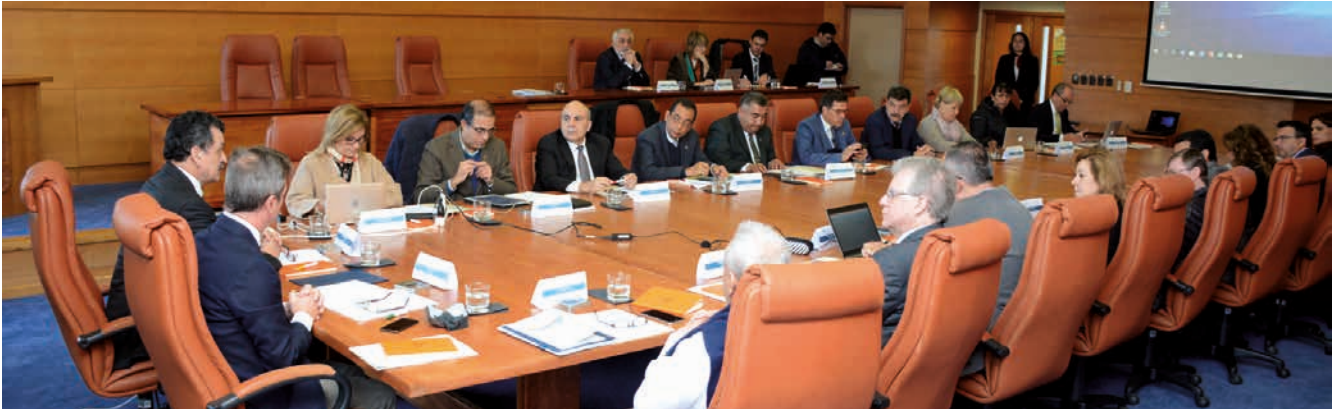
Los miembros de la Comisión Ejecutiva reunidos en Valdivia, en la Universidad Austral de Chile, el 18 de octubre de 2018.