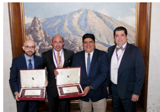
Vista general del público en el acto de entrega de los Premios AUIP a la calidad celebrado en el Real Casino de Tenerife, 23 de marzo de 2018. En primer fila puede verse a los galardonados. En la foto de la derecha, los coordinadores de la Maestría en RRLL y del doctorado en Métodos alternos de solución de Conflictos de la U. Autónoma de Nuevo León galardonados con los Premios AUIP.