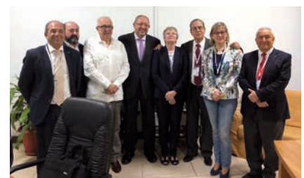
Reunión con el Ministro de Educación Superior de Cuba, Rector y vicerrector de la UNIA, Secretario General de Universidades de la Junta de Andalucía, y Vicerrectoras de la UGR con ocasión de la celebración de la Junta Consultiva sobre el Postgrado.